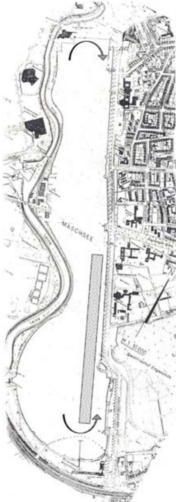
Anlage 1 (Maschseekarte)